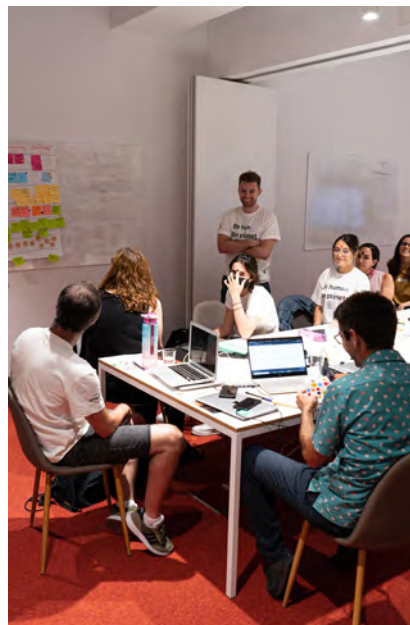
B LAB SPAIN

↓ Reunión durante un encuentro informal de la Fundación B-Lab Spain.